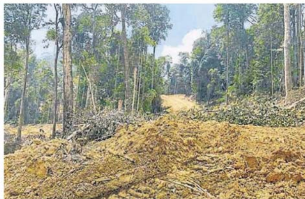
伐。拉卡森林保留地的第32分块),遭破坏和砍 八打灵县巫金哥打拉惹森林地(前武吉遮

“在州土地上的萤火虫栖息地被破坏,该组织关注瓜拉雪兰莪甘榜关丹的萤火虫栖息地受破坏是因沿雪兰莪河的农业和采沙活动而遭破坏。”