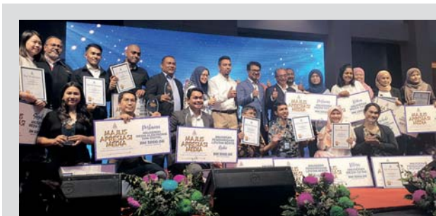
Pengamal media yang menerima anugerah,semalam.