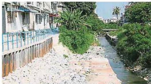
修建防洪沟的第二工程即将在5月份展开,让两岸房屋的居民不再担惊受怕。