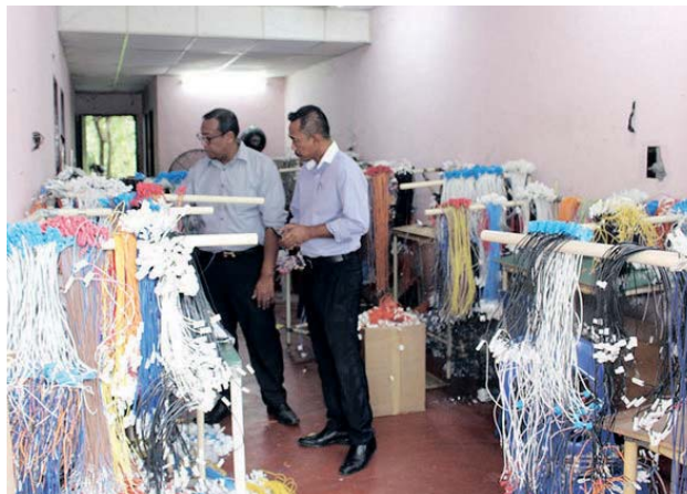
Ruang dalam asrama dipenuhi barangan elektronik dan wayar.

Menurutnya, pihaknya bertindak atas aduan penduduk yang tidak tahan menghidu bau busuk hasil daripada pencemaran bau dari penempatan warga asing