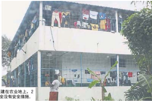
■部分宿舍是违例建在农业地上，2层楼高的建筑却完全没有安全措施。