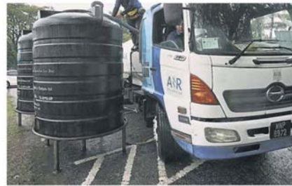
雪州水务资产整合后，市场传出将会全面调高水费。

分析员浏览水务、土地与天然资源部官网后，发现自去年 9 月起，与减少无收益水相关的计划，已在各州陆续展开招标，且这类招标工程有增加的趋势。