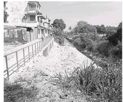
主要排水沟在首阶段完成了前端的防护墙工作。