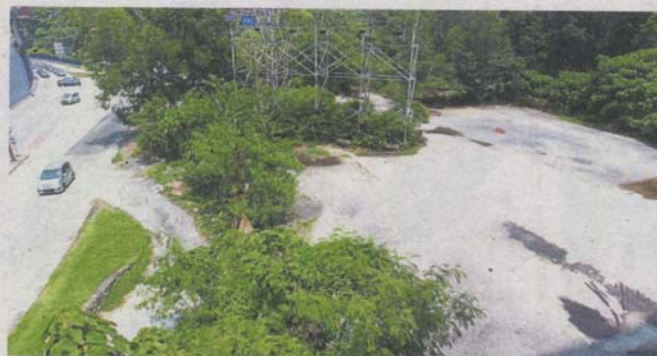
Residents in Section 16 are concerned about the proposed high-rise development in the area.

Developer assures it will comply with requirements from authorities