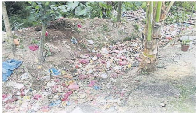
■直落坡聚集许多外劳宿舍，垃圾也乱丢，导致环境卫生恶劣。