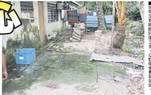
■外劳没有照顾环境卫生，以致宿舍青苔处处。