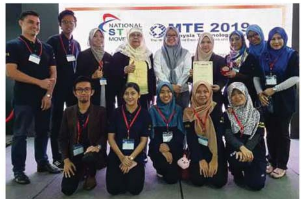
Sebahagian pensyarah UNISEL meraikan kejayaan mereka pada MTE 2019 di Kuala Lumpur, baru-baru ini.

"Kami menerima banyak maklum balas positif sepanjang pertandingan ini berlangsung dan berharap dapat menjalin kerjasama dengan banyak pihak seterusnya mengangkat modul ini ke peringkat yang lebih tinggi," katanya.