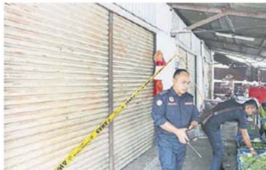
■3间非法营业的店铺被执法单位当场查封。