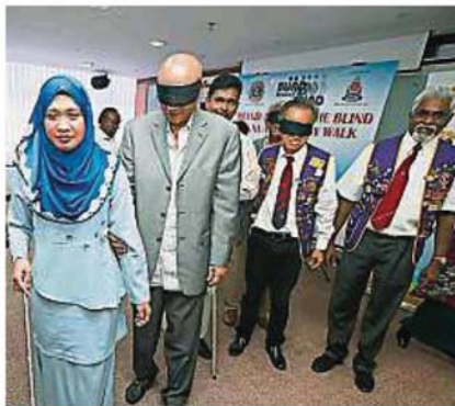
第13届盲人慈善义走是由一人蒙着双眼，让另一人带领走路，体验失去视力的困难。